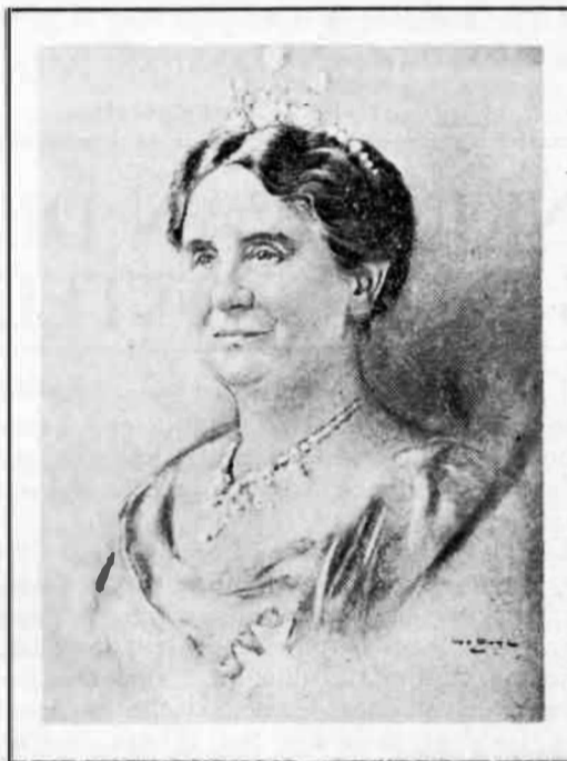
Men leerde uit Haar de Majesteit bewaren In eer, ontzag en aanzien, te gelijk gevreesd, bemind en aangebeên in 't Rijk en buiten 't Rijk, zoo wijd haar zeilen varen. Joost van den Vondel.

Onze katholieke levensbeschouwing moet uitstralen in heel de katholieke pers, niet alleen in de hoofdartikelen over internationale verhoudingen, over politiek, over economie,